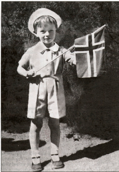
GAYKID: Byrådsleder Erling Lae