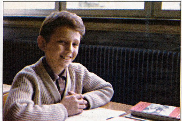
GAYKID: Høyres stortingsrepresentant Per-Kristian Foss.