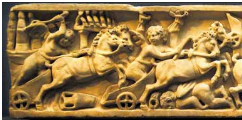
BRUTALT: Ut fra vår samtids perspektiv er det slående hvor fylt av brutalitet, skrekk og en barnesarkofag fra Roma.

satyren til et tre og får ham levende! Satyrens blod ble til en elv. Heldigvis er det selve konkurransen som fremstilles, og ikke utgangen på historien. Den skjebne som venter en som lider av overmot er grusom, og bildet blir en opplæring i å akseptere det å bli utsatt for grusomheter. Det ideologiske innholdet er det all grunn til å problematisere.