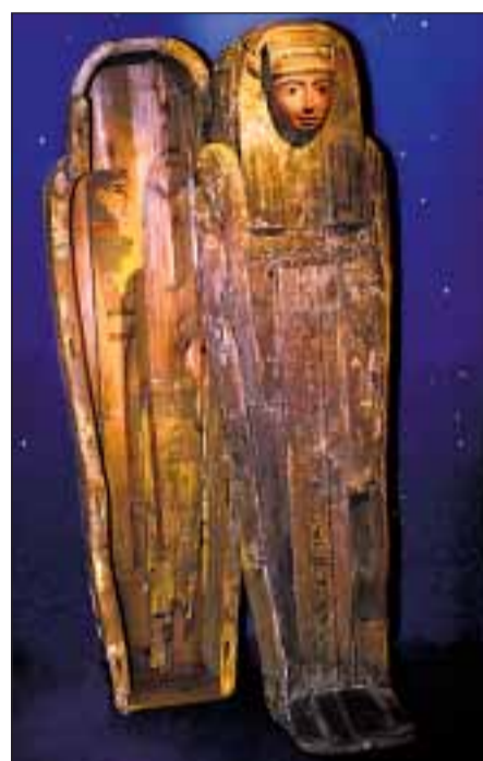
STORSLÅTT: Egyptisk mumiekiste.

Øivind Storm Bjerke kunst@klassekampen.no