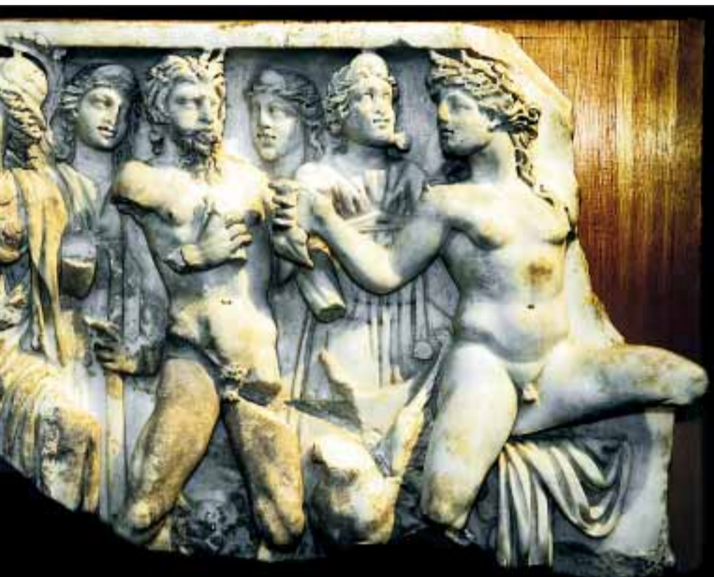
utsettes for voldsomme grusomheter. Her fragment av en gravskulptur fra Hellas.