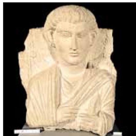
VAKKERT: Relieffbyste fra Palmyra.