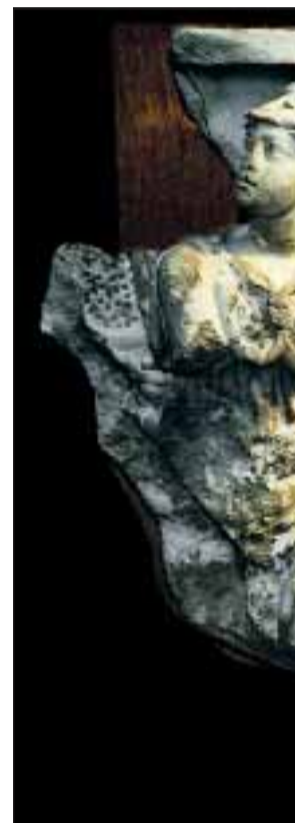
STERKT: Satyren Marsya