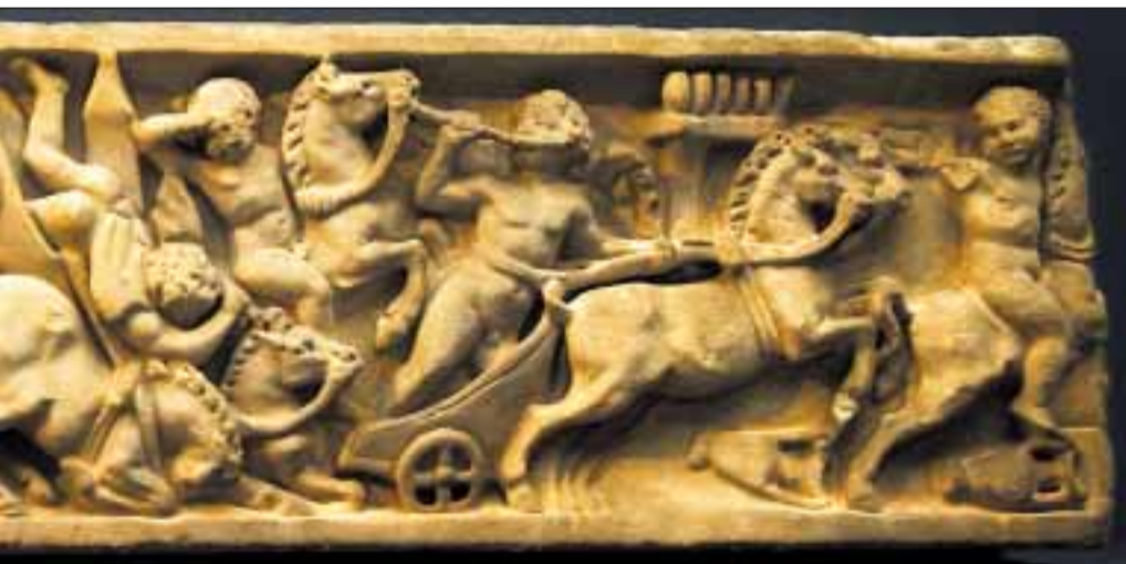
resignasjon konfrontasjonen med døden er i antikken, skriver Øivind Storm Bjerke. Her