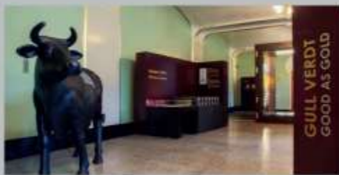
钱币收藏馆的周年纪念展览

这是挪威最大的硬币收藏, 包含 2600 年来的金币。而且您可以研究世界上第一枚硬币。您还可以看到1940年4月9日德国纳粹军队占领挪威时所撤离的国库藏金, 以及 弗里乔夫内森 (Fritjof Nansen) 和 罗尔德阿蒙森 (Roald Amundsen) 的勋章。