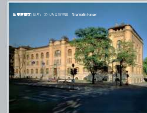
历史博物馆

博物馆的主要任务是研究、管理和展示我们共同的历史。博物馆的展览反映了我们在考古学、民族志和钱币学等领域的专业知识。