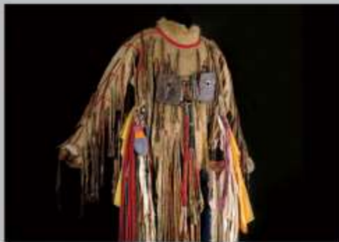
图瓦人的巫师服饰 服饰中的所有织物均彰显巫师的能力和力量

北极圈以北的民族和文化之间的共同点是什么? 如何区别? 本展览将展示格林兰岛、西伯利亚、加拿大北部、阿拉斯加和萨米人 (萨米地区) 的传统服装、工具和设备、艺术品和手工艺品等。不容错过的是罗尔德阿蒙森在 1903 至 1906 年穿过西北航道探险之旅独特的文物搜藏品。