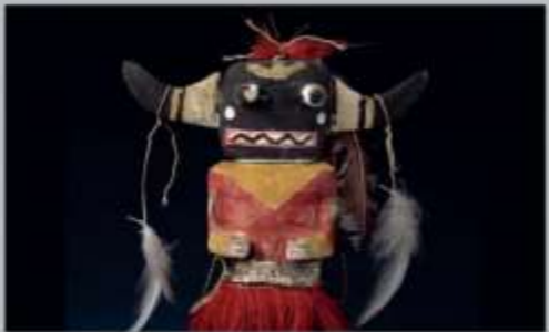
来自美国亚利桑那州霍皮的卡奇娜娃娃