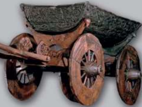
奥赛贝格号 (Oseberg) 上的木车 | 照片：文化历史博物馆, Eirik Irgens Johnsen

近距离观察维京时代最丰富的宝藏。维京船博物馆收藏着世界上保存最完好的维京船，在奥斯陆峡湾附近的农庄中发现。他们在成为他们富有的主人的最后安息地之前穿过了海洋。您还可以看到令人惊叹的木雕、神秘的骨骼遗迹，以及一部让您回到维京时代的引人入胜的电影。