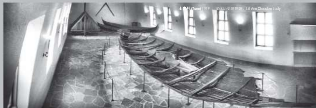
土内号 (Tune)

奥赛贝格号在 820 年前后建造完成，拥有华丽的装饰和精美的雕刻。公元 834 年，该船成为了两位有权势的女性的陪葬品。在去往死亡之域的最后旅途中，人们为这两位女性准备的随葬品十分丰富：三架精致的雪橇、一辆木质推车、五个雕刻的兽首杆、五个床铺以及 15 匹马、6 只狗和两只奶牛的骸骨等等。这些随葬文物大多在维京船博物馆展出。