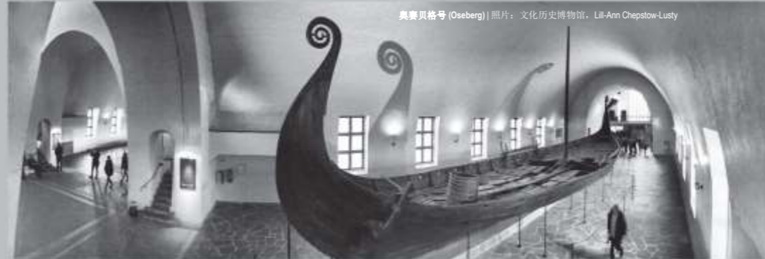
奥赛贝格号 (Oseberg) | 照片：文化历史博物馆, Lil-Ann Chepstow-Lusty