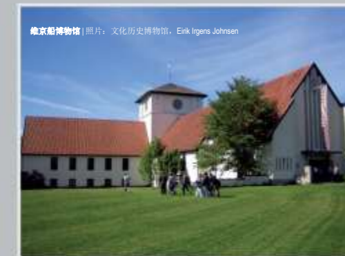
维京船博物馆