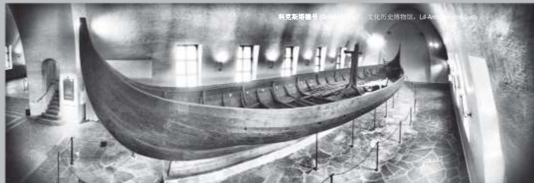
科克斯塔德号 (Gokstad)