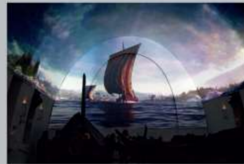
维京船博物馆新的互动影片带给观众一个特别的视觉之旅，进入维京船的历史。从船只的建造，到它们在峡湾和海洋中的使用，最后成为国王或王后的埋葬船。