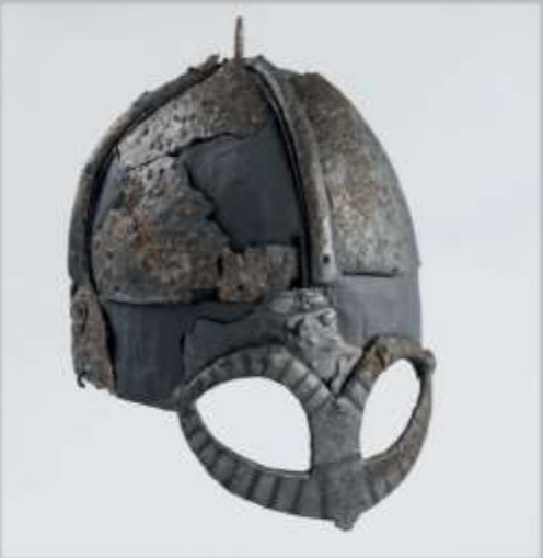
世界上保存最完好的维京头盔, 来自 Gjermedbu