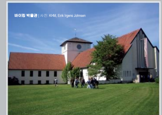
바이킹 박물관