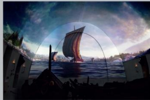
바이킹 박물관의 새로운 인터랙티브 영화는 바이킹 선박의 역사를 살펴보는 특별한 시각적 여정을 대중에게 공개합니다. 선박이 건조되는 과정부터 피오르드와 바다를 항해하는 선박의 모습, 그리고 마지막으로 왕과 왕비의 장례선까지 바이킹 선박의 일생을 살펴볼 수 있습니다.