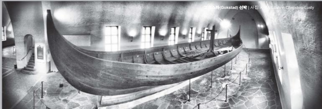
고크스타(Gokstad) 선박