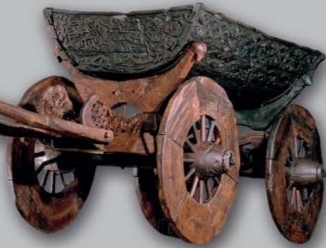
오세베르그(Oseberg) 선박의 나무 손수레

바이킹 시대의 가장 풍요로운 보물들을 가까이서 볼 수 있습니다. 바이킹 박물관의 기념품 매장에서는 오슬로 피오르드(Oslo fjord) 주변의 무덤에서 발굴한, 세상에서 가장 잘 보존된 바이킹 선박을 전시합니다. 부유한 선주의 마지막 안식처가 되기 전에 바다를 향해했던 이 선박 외에도 놀라운 목각 장식품, 신비한 해골 유물과 바이킹 시대로 빠져들게 할 영화 등을 관람하실 수 있습니다.