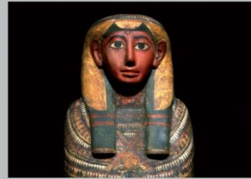
약 2,700년 전 사원 수호대의 말을 위한 미라의 관(Dismutenibtes)

고대 이집트의 석관, 미라, 그리고 장례식 선물 등을 볼 수 있는 전시회입니다. 석관은 파라오 시대에 세 곳의 제국에서 발견된 것입니다. 이집트 컬렉션의 수많은 유물은 19세기 박물관에 기부되었습니다.