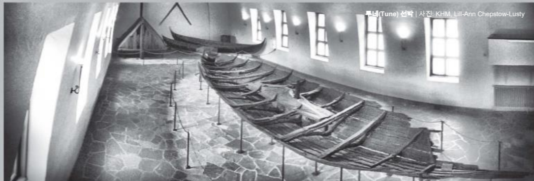
투네(Tune) 선박

오세베르그(Oseberg) 선박 은 820년경에 건조되었으며 섬세한 조각 무늬가 새겨져 있습니다. 서기 834년, 선박은 강력한 영향력을 가진 두 명의 여성을 위한 장례선으로 사용되었습니다. 두 명의 여성은 정교한 썰매 3대, 나무 손수레, 동물의 머리 형상을 한 조각 공예품 5개, 침대 5개를 비롯하여 말 15마리, 개 6마리, 소 2마리의 뼈대 등 방대한 매장 물품과 함께 사후 세계를 향하는 마지막 여정에 올랐습니다. 바이킹 박물관에서 대부분의 부장품을 직접 확인하실 수 있습니다.