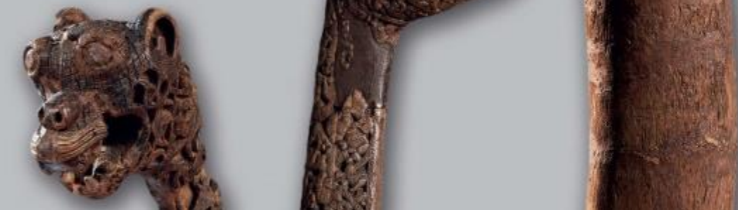
왼쪽에서 오른쪽 방향: 오세베르그(Oseberg)에서 발견된 동물 머리 형상의 공예품

Bygdøy의 새로운 바이킹 시대 박물관이 개장을 준비하고 있습니다. 이 새로운 박물관은 바이킹 시대 전반기의 지식을 확인할 수 있는 가장 영향력 있는 역사 중심지로 거듭나기 위해 최선의 노력을 기울이고 있습니다. 바이킹 장례선과 풍부한 매장물은 박물관에서 확보한 기타 바이킹 시대의 공예품과 함께 전시될 계획입니다.