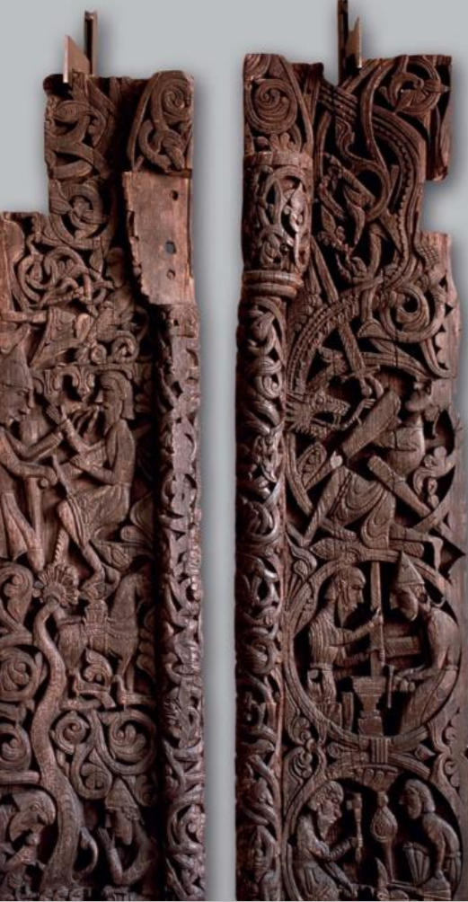
힐레스타드(Hyllestad)의 스타브(Stave) 교회 출입문, Sigurd Favnesbane

중세 시대를 테마로 하는 이 중요한 전시회는 노르웨이 역사상 가장 방대한 스타브(Stave) 교회 출입문 컬렉션과 노르웨이 교회들의 예술 작품들을 전시합니다. 또한, 일상 생활과 기념식에 사용되었던 물건들도 보실 수 있습니다.