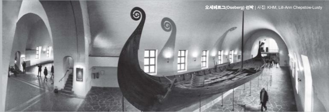
오세베르그(Oseberg) 선박 | 사진: KHM, Lill-Ann Chepstow-Lusty