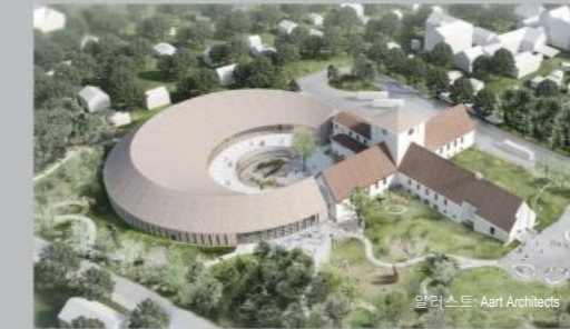
아키텍처: Aart Architects

Bygdøy의 새로운 바이킹 시대 박물관이 개장을 준비하고 있습니다. 이 새로운 박물관은 바이킹 시대 전반기의 지식을 확인할 수 있는 가장 영향력 있는 역사 중심지로 거듭나기 위해 최선의 노력을 기울이고 있습니다. 바이킹 장례선과 풍부한 매장물은 박물관에서 확보한 기타 바이킹 시대의 공예품과 함께 전시될 계획입니다.