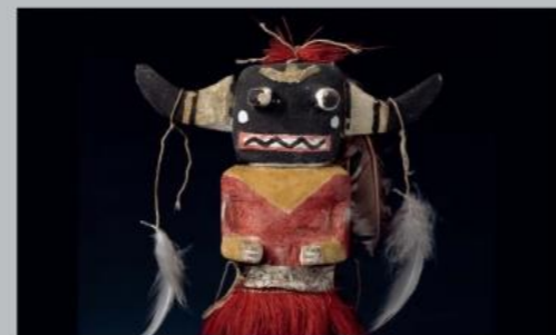
미국 에리조나주 호피족의 카치나(Kachina) 인형

미국 - 현재 - 과거 - 정체성. 이 전시회에서는 더 넓은 세상과 마주한 원주민과 소수 민족이 그들의 정체성과 전통을 어떻게 확립했는지 알아볼 수 있습니다. 가면, 목각 장식품, 비즈 장식품과 의상 등을 볼 수 있습니다. 또한 호피족 도예가인 남페요(Nampeyo)의 혁신적인 디자인, 아마존의 아름다운 깃털 공예 및 쿠바에서 기원한 종교인 산테리아 등 다양한 주제를 경험할 수 있습니다.