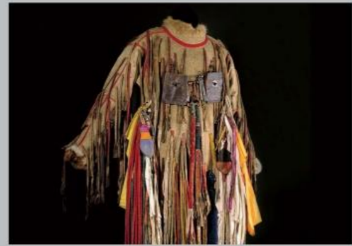
투바 부족의 무복 의상의 모든 옷감은 주술사의 힘과 세력을 상징합니다.

이 전시회는 그린란드, 시베리아, 캐나다 북부, 알래스카 및 라플란드(사미족) 지역의 전통 의상, 도구, 장비 및 예술 작품/공예품을 통해 북극권 한계선 북쪽에 거주하는 부족과 그들의 문화 사이에 존재하는 공통점과 차이점을 살펴볼 수 있는 기회를 선사합니다. 로알 아문센이 1903년~1906년 사이에 북서항로를 전진하는 당시 과정에서 수집한 특별한 공예품들도 놓쳐서는 안 되는 볼거리입니다.