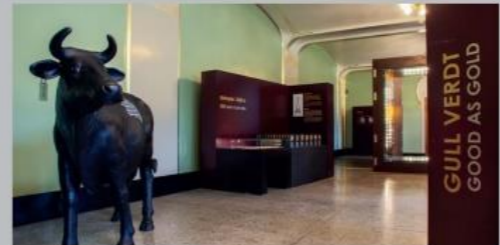
동전 전시관(Coin Cabinet)의 기념 전시회

금의 가치를 지닌 물건 - 동전이 역사가 되다 이것은 노르웨이에서 가장 큰 규모의 동전 컬렉션으로, 2,600년의 역사를 담고 있습니다. 이 컬렉션에서 무엇보다 중요한 건 세계 최초의 동전을 볼 수 있다는 것입니다. 1940년 4월 9일 독일 나치 부대가 노르웨이를 점령했을 때 숨겨두었던 보물과 프리드쇼프 난센(Fridtjof Nansen)과 로알 아문센(Roald Amundsen)의 훈장과 금메달로 이루어진 대규모 컬렉션도 놓칠 수 없는 재미입니다.