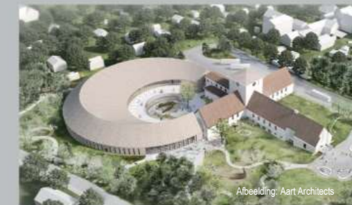
Abbeelding: Aart Architects

NIEUW VIKINGTIJDSMUSEUM op Bygdøy is in voorbereiding. De visie voor het nieuwe museum is het creëren van een wereldwijd toonaangevend centrum voor de verspreiding van kennis over de Vikingtijd. Hier zullen de rijke vondsten uit de Vikingschipgraven worden tentoongesteld, samen met een uitgebreide selectie van voorwerpen uit de Vikingtijdcollectie van het museum.