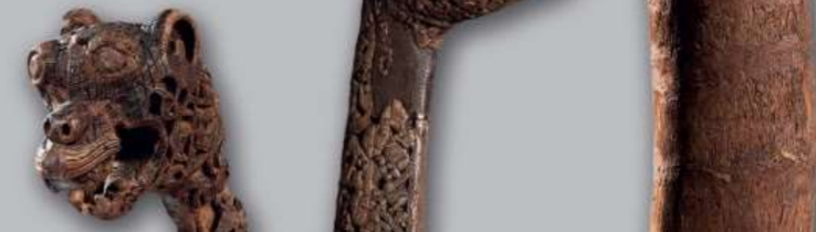
Rechts: Dierenkopornamenten uit het Osebergskip

NIEUW VIKINGTIJDSMUSEUM op Bygdøy is in voorbereiding. De visie voor het nieuwe museum is het creëren van een wereldwijd toonaangevend centrum voor de verspreiding van kennis over de Vikingtijd. Hier zullen de rijke vondsten uit de Vikingschipgraven worden tentoongesteld, samen met een uitgebreide selectie van voorwerpen uit de Vikingtijdcollectie van het museum.