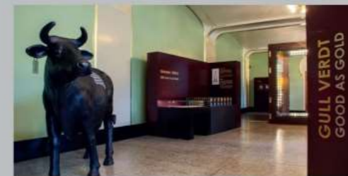
Uit de jubileumtentoonstelling van het muntenkabinet

Deze muntenverzameling - de grootste van Noorwegen - omvat gouden munten uit een periode van 2600 jaar. U kunt hier onder andere de eerste munt ter wereld bestuderen. Ook ziet u de goudschat die op 9 april 1940 werd geëvacueerd toen de Duitse nazitroepen Noorwegen bezetten, en de uitgebreide verzameling onderscheidingen en gouden medailles van Fridtjof Nansen en Roald Amundsen.