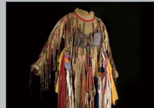
Kostuum van een Toevaanse sjamaan

Wat verbindt mensen en culturen ten noorden van de poolcirkel – en wat scheidt ze? De expositie toont traditionele kleding, gereedschap en ambachtelijke producten uit Groenland, Siberië, Noord-Canada, Alaska en Sápmi, het territorium van de Samen. Wat u natuurlijk niet mag missen is de unieke Roald Amundsen-collectie van de expeditie door de Noordwestelijke Doorvaart tussen 1903 en 1906.