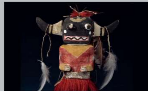
Kachina-pop van de Hopi, Arizona, Verenigde Staten

Deze tentoonstelling laat zien hoe inheemse volkeren en minderheden hun identiteit en traditie vormgeven binnen de maatschappij als geheel. U kunt onder andere maskers, houtsnijwerk, kraalwerk en kleding bekijken. Ontdek het innovatieve design van Hopi-keramist Nampeyo, prachtige verenkunst uit het Amazonegebied en een religieus Santería-altaar uit Cuba.