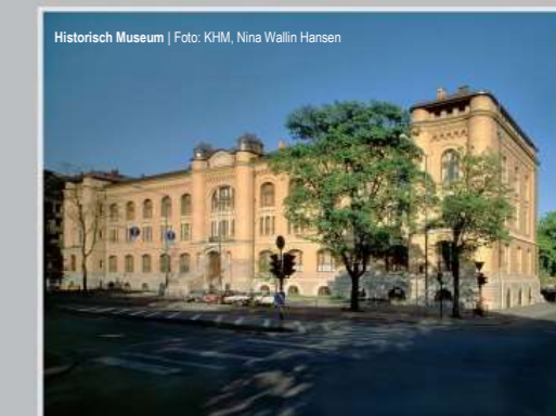
Historisch Museum

De belangrijkste taak van het museum is het onderzoeken, beheren en verspreiden van onze gemeenschappelijke geschiedenis. De tentoonstellingen in de musea weerspiegelen onze levende vakgebieden op het gebied van onder andere archeologie, etnografie en numismatiek.