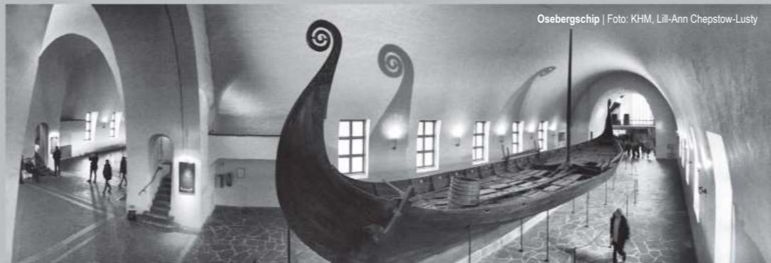
Osebergskip | Foto: KHM, Lill-Ann Chepstow-Lusty

De nieuwe belevingsfilm van Vikingskipshuset neemt het publiek mee op een unieke visuele reis door de geschiedenis van het Vikingschip. U ziet hoe het Vikingschip werd gebouwd, hoe het door fjorden en op zee vaart en hoe het ten slotte eindigt als grafship voor een koning of koningin. Foto: KHM, Mårten Teigen