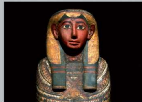
De ca. 2700 jaar oude kist van de dochter van tempelwachter Dismutenibtes

Hier kunt u sarcophagen, mummies en grafijten uit het Oude Egypte zien. De mummiekisten vertegenwoordigen drie verschillende dynastieën uit de tijd van de farao's. Veel van de voorwerpen uit de Egypte-expositie zijn al in de 19e eeuw aan het museum geschonken.