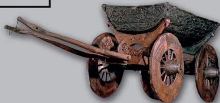
Wagen uit het Osebergskip | Foto: KHM, Eirik Irgens Johnsen

Beleef de rijke schatten uit de Vikingtijd van dichtbij. Vikingskipshuset herbergt 's werelds best bewaarde Vikingschip, gevonden in grafheuvels rond de Oslofjord. Met dit schip is over de zee gevaren totdat het de laatste rustplaats werd voor zijn hooggeplaatste eigenaars. U ziet hier ook verbazingwekkend houtsnijwerk, mysterieuze skeletresten en een meeslepende film die u meeneemt naar de Vikingtijd.