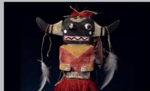
Lalki Kaczyni ludu Hopi z Arizony (USA)

Wystawa pokazuje, jak tubylcze ludy i mniejszości kształtują swoją tożsamość i tradycje w społeczeństwie. Znajdziesz tu między innymi maski, rzeźbione przedmioty drewniane, perłowe hafty i ubrania. Poznaj innowacyjne wytwory gamcarza Nampeyo z ludu Hopi, piękne amazońskie dzieła sztuki tworzone z piór, a także ołtarz religijny Santeria z Kuby.