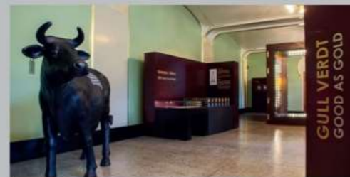
Z jubileuszowej wystawy witriny z monetami

Jest to największa norweska kolekcja monet, zawierająca złote monety z okresu obejmującego 2600 lat. Możesz tu między innymi dokładnie przyjrzeć się pierwszej monecie na świecie. Zobacysz też Złoty Skarb, który został ewakuowany, gdy nazistowskie wojska niemieckie zajęły Norwegię 9 kwietnia 1940 roku, a także bogaty zbiór orderów i złotych medali Fridtjofa Nansena i Roalda Amundsen.