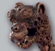
Po prawej: Rzeźby z głowami zwierząt z Oseberg

NOWE MUZEUM EPOKI WIKINGÓW w Bygdøy jest dziś na etapie planowania. Wizją dla nowego muzeum jest stworzenie wiodącego na świecie centrum popularyzacji wiedzy o epoce wikingów. Zostaną tu wystawione bogate znaleziska z pogrzebowych łodzi wikingów wraz z licznymi przedmiotami pochodzącymi z pozostałych kolekcji muzeum, dotyczących epoki wikingów.