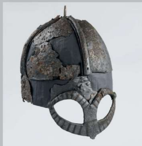
Najlepiej na świecie zachowany hełm wikingów z Gjernundbu | Zdjęcie: KHM, Ellen C. Holte