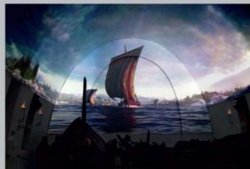
Nowy film przygodowy w Muzeum Łodzi Vikingów zabiera odwiedzających w niezwykłą wizualną podróż do historii łodzi wikingów. Od budowania łodzi, przez jej rejsy po fiordach i morzach, aż po zakończenie służby jako łódź pogrzebowa króla lub królowej.