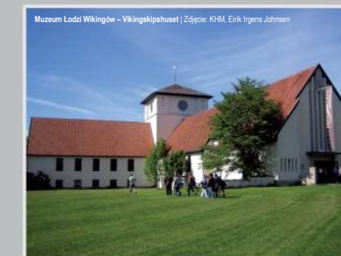
Muzeum Łodzi Vikingów – Vikingskipshuset