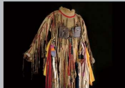
Strój szamana z Tuwy Wszystkie kawałki tkaniny pokazują połęgę i siłę szamana

Co łączy ludzi i kultury istniejące na północ od koła podbiegunowego – i co je różni? Wystawa pokazuje tradycyjne stroje, narzędzia i rzemiosło z Grenlandii, Syberii, północnej Kanady, Alaski i Sápmi, regionu geograficznego zamieszkiwanego przez Samów. Nie przegap niezwykłej kolekcji Roalda Amundsen z wyprawy przez Przejście Północno-Zachodnie w latach 1903-1906.