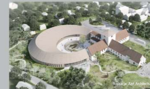
Ilustracja: Aart Architects

NOWE MUZEUM EPOKI WIKINGÓW w Bygdøy jest dziś na etapie planowania. Wizją dla nowego muzeum jest stworzenie wiodącego na świecie centrum popularyzacji wiedzy o epoce wikingów. Zostaną tu wystawione bogate znaleziska z pogrzebowych łodzi wikingów wraz z licznymi przedmiotami pochodzącymi z pozostałych kolekcji muzeum, dotyczących epoki wikingów.