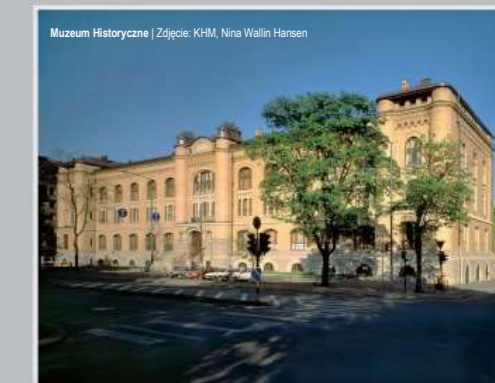
Muzeum Historyczne | Zdjęcie: KHM, Nina Wallin Hansen

Głównym zadaniem muzeum jest badanie, ochrona i przekazywanie naszej wspólnej historii. Wystawy w muzeach to efekty pracy naszych żywych środowisk akademickich, co obejmuje między innymi archeologię, etnografię i numizmatykę.