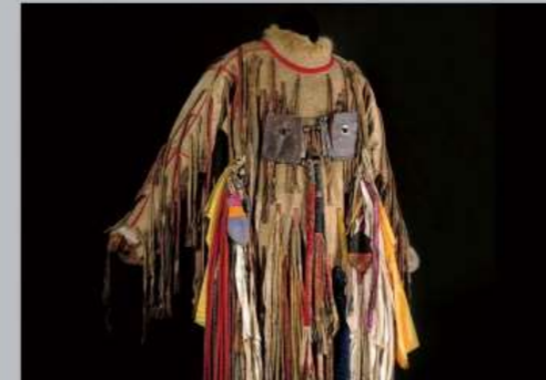
Traje do Xamã da comunidade de Tuva Todos os tecidos do vestuário demonstram o poder e a força do xamã

O que as pessoas e culturas ao norte do Círculo Ártico têm em comum e o que as diferencia? Esta exposição exhibe roupas tradicionais, ferramentas e artes e artesanato da Groenlândia, Sibéria, norte do Canadá, Alasca e Sápmi (o território do povo Sami). Não perca esta exclusiva coleção de artefactos da expedição de Roald Amundsen pela Passagem do Noroeste entre 1903 e 1906.