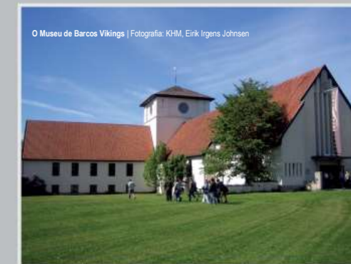
O Museu de Barcos Vikings