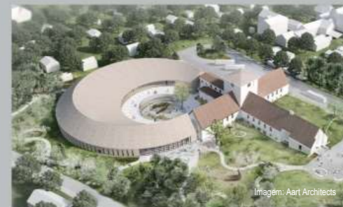
Imagem: Aarí Architects

UM NOVO MUSEU DA ERA VIKING está a ser planeado em Bygdøy. O objetivo do novo museu é criar um centro líder mundial para a disseminação do conhecimento sobre a Era dos Vikings. Os barcos funerários dos Vikings e as suas riquezas serão exibidos com uma extensa seleção de artefactos dos outros tesouros da era Viking do museu.