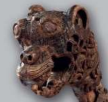
Lado direito: Cabeça de animal da descoberta de Oseberg

UM NOVO MUSEU DA ERA VIKING está a ser planeado em Bygdøy. O objetivo do novo museu é criar um centro líder mundial para a disseminação do conhecimento sobre a Era dos Vikings. Os barcos funerários dos Vikings e as suas riquezas serão exibidos com uma extensa seleção de artefactos dos outros tesouros da era Viking do museu.