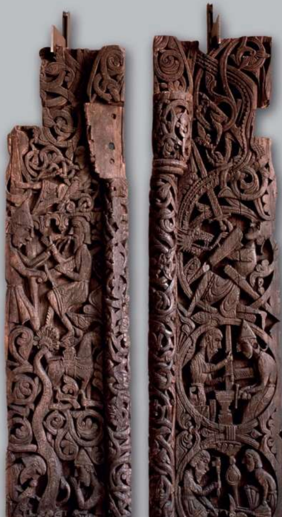
Entrada da igreja de madeira da Hyllestad com detalhes de Sigurd Favnesbane

Esta grande exposição sobre a Idade Média hospeda a maior coleção de entradas de igrejas e tesouros de arte da Noruega de igrejas da Noruega. Também poderá observar objetos da vida quotidiana e celebrações.