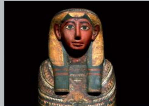
O túmulo com aproximadamente 2700 anos da filha do Guarda do Templo, Dismutenibtes

Aqui poderá encontrar sarcófagos, múmias e presentes funerários do Antigo Egito. Os sarcófagos são de três dinastias diferentes durante a Era dos Faraós. Vários dos artefactos da coleção do Egito foram doados ao museu no século 19.