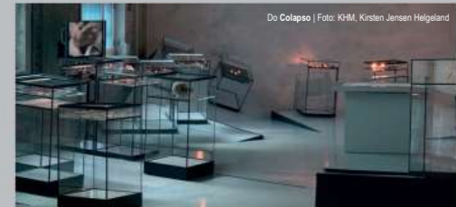
Do Colapso

O museu é o lar de exposições sobre a história da Noruega, que vão desde a Idade da Pedra até à era Viking e à Idade Média. Explore a nossa rica coleção de entrada de igrejas de madeira, encontre as múmias egípcias e consiga uma visão da diversidade cultural do mundo nas nossas exposições etnográficas. O edifício do museu de 1904 é em si um magnífico exemplo da arquitetura Art Nouveau e os ricos adornos têm uma mistura rara de elementos noruegueses e internacionais.