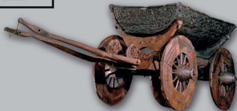
Carrinho de madeira do barco de Oseberg

Aprece os mais ricos tesouros da era Viking de perto. O Museu de Barcos Vikings abriga os barcos viking mais bem preservados do mundo, encontrados em túmulos ao redor do fiorde de Oslo. Eles cruzaram os mares antes de se tornarem nos locais finais de descanso dos seus ricos proprietários. Também poderá ver incríveis esculturas em madeira, misteriosos restos de esqueletos e um cativante filme que o leva de volta à era Viking.