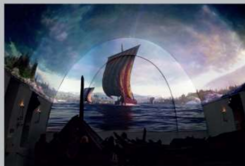
A nova experiência videográfica no Museu de Barcos Vikings leva o público numa viagem visual única pela história de um barco Viking. Da construção dos barcos, pela sua utilização em fiordes e oceanos, e finalmente como barcos funerários para um rei ou uma rainha.