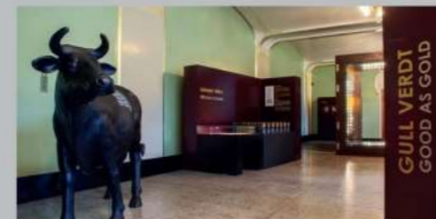
Da exposição de aniversário do Armário de Moedas

Esta é a maior coleção de moedas da Noruega e contém moedas de ouro com uma história de 2600 anos. Entre outros, pode estudar a primeira moeda do mundo. Poderá também ver o tesouro que foi evacuado quando as tropas alemãs nazis ocuparam a Noruega a 9 de abril de 1940, bem como a extensa coleção de medalhas de ouro de Fridtjof Nansen e Roald Amundsen.