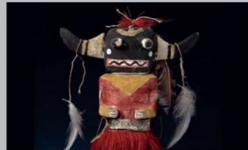
Boneca Kachina de Hopi, Arizona, EUA

Esta exposição mostra como os povos indígenas e minorias formam sua identidade e tradições em encontros com o resto do mundo. Aqui poderá encontrar máscaras, esculturas de madeira, bordados com missangas e vestuário. Experimente os designs inovadores do oleiro de Hopi Nampeyo, a bela arte de penas da Amazônia e um altar Santeria religioso de Cuba.