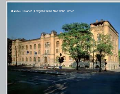
O Museu Histórico

As principais tarefas do museu são pesquisar, gerir e exibir a nossa história partilhada. As exposições nos museus refletem a nossa experiência em áreas como a arqueologia, etnografia e numismática.