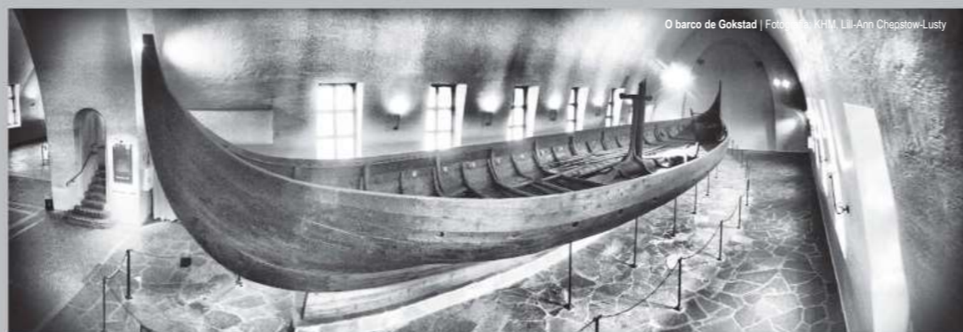
O barco de Gokstad