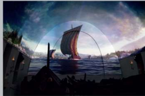
ภาพยนตร์ชุดใหม่ล่าสุดของพิพิธภัณฑ์เรือไวกิ้ง นำผู้เข้าชมเดินทางผ่านการขุดพบที่แปลกกันเฉพาะตัวไปสู่ประวัติศาสตร์ของเรือไวกิ้ง นับตั้งแต่การขุดพบเรือ ผ่านการใช้งานในพิพิธภัณฑ์และมหาสมุทรต่าง ๆ สู่ทำเนียบฝังศพของพระราชินีและพระราชินี