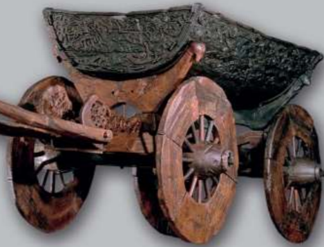
รถลากไม้จากเรือโอเซแบร์ก | ภาพถ่าย: เอริก อีริกเซน โยห์นเซน (Eirik Irgens Johnsen) พิพิธภัณฑ์ประวัติศาสตร์วัฒนธรรม (KHM)

คุณสมบัติอันเป็นสุดยอดแห่งความมั่งคั่งในยุคไวกิ้งอย่างใกล้ชิด พิพิธภัณฑ์เรือไวกิ้งจัดแสดงเรือไวกิ้งที่อยู่ในสภาพสมบูรณ์ที่สุดในโลก ซึ่งขุดพบที่เนินฝังศพในบริเวณออสโลฟยอร์ด ชาวไวกิ้งเดินทางข้ามทะเลมาก่อนที่จะหยุดพักและกลายเป็นเจ้าของดินแดนผู้มั่งคั่งในที่สุด นอกจากนี้ คุณยังจะได้เห็นงานแกะสลักไม้ที่น่าตื่นตาตื่นใจ ซากโครงกระดูกที่สลัก และรับชมภาพยนตร์ที่น่าสนใจซึ่งจะนำคุณย้อนกลับไปสู่ยุคไวกิ้ง