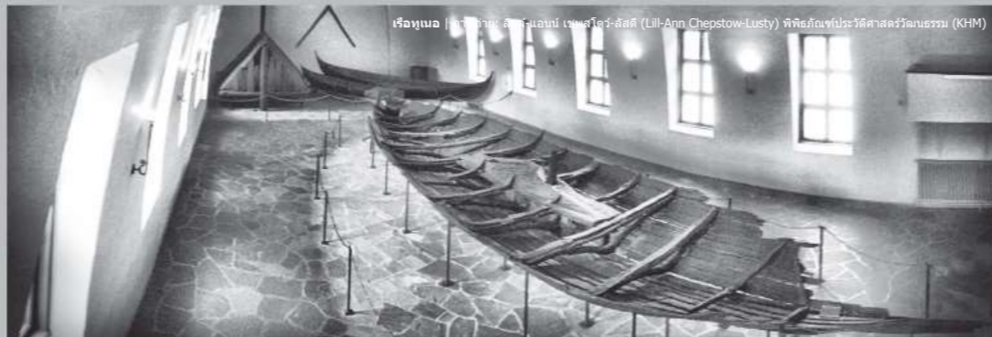
เรือทูเนอ | ภาพถ่าย: ลิลล์-แอนน์ เชพสโตว์-ลัสตี้ (Lill-Ann Chepstow-Lusty) พิพิธภัณฑ์ประวัติศาสตร์วัฒนธรรม (KHM)

เรือโอเซแบร์ก (Oseberg Ship) สร้างขึ้นราวปี 820 โดย ได้รับ การตกแต่งอย่างหรูหราตามด้วยงานแกะสลักที่ละเอียดประณีต ในปี 834 มีการใช้เรือดังกล่าวในการฝังศพสตรีเรืออานาจสองคน ในการเดินทางครั้งสุดท้าย ไปสู่ ดินแดนแห่งสุดท้าย มีการฝังสิ่งของเครื่องใช้จำนวนมากไปกับศพของสตรีทั้งสอง ได้แก่ เลื่อนหิมะที่จัดทำอย่างละเอียดประณีต 3 คัน รถลากไม้ หวีเสาสีสลัก เป็นรูปหัวสัตว์ 5 ชิ้น เติง 5 หลัง รวมถึงโครงกระดูกม้า 15 ตัว สุนัข 6 ตัว และวัว 2 ตัว วัตถุที่ฝังรวมไปกับศพส่วนใหญ่ได้รับการจัดแสดงในพิพิธภัณฑ์เรือไวกิ้ง