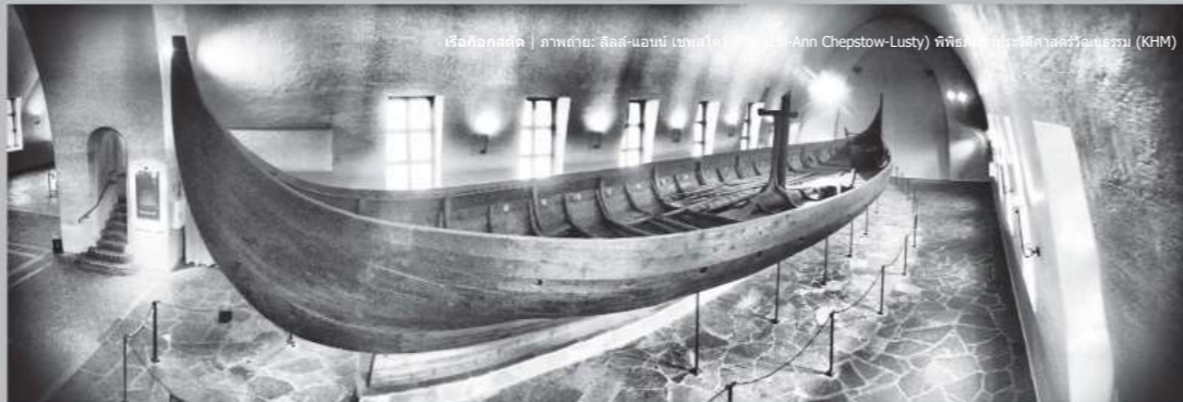
เรือกอกสตัด