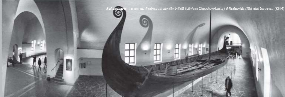
เรือโอเซแบร์ก