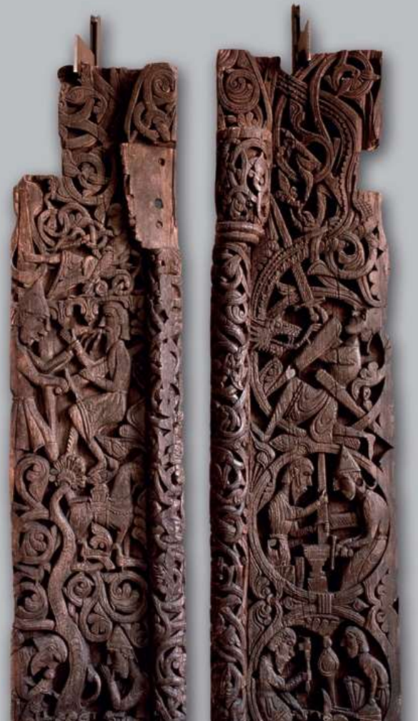
ประตูทางเข้าออกโบสถ์หลังคาชั้นบันไดจากฮิลเลสต์าด (Hyllestad) พร้อมภาพเงาของราชวงศ์กรูด ฟาฟเนบานเนอ (Sigurd Favneshane)

นิทรรศการหลักเกี่ยวกับยุคกลางจัดแสดงประติมากรรมของโบสถ์หลังคาชั้นบันไดและงานศิลปะที่ล้ำค่าจากโบสถ์ต่างๆ ทั่วนอร์เวย์ นอกจากนี้ คุณยังจะได้เห็นวัตถุต่างๆ ที่ใช้ในชีวิตประจำวันและงานเจลิมจลอง