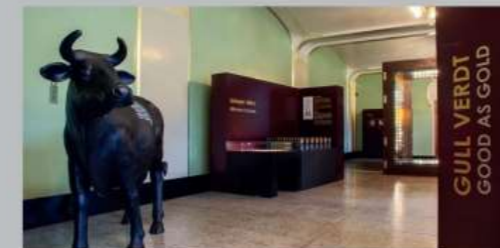
จากนิทรรศการรับชมแบบมีเสียงเกี่ยวกับเหรียญ

ประโยชน์ล้ำค่า – เมื่อเหรียญกลายเป็นประวัติศาสตร์ นี่เป็นการจัดแสดงเหรียญซึ่งมีจำนวนมากที่สุดในนอร์เวย์ และมีเหรียญทองที่มีประวัติความเป็นมายาวนานถึง 2,600 ปี คุณจะได้เรียนรู้เกี่ยวกับ เหรียญอันแรกของโลกพร้อมกับสิ่งของที่จัดแสดงขึ้นอีกด้วย นอกจากนี้ คุณยังจะได้เห็นชุมชนบัตต์ที่มีการเคลื่อนย้ายเมื่อกองทัพนาซีเยอรมันเข้ายึดครองนอร์เวย์ในวันที่ 9 เมษายน 1940 ตลอดจนเหรียญตราและเหรียญจำนวนมากที่ฟริดตโยฟ นันเซน (Fridtjof Nansen) และรูอัลด์ อามุนด์เซน (Roald Amundsen) สะสมไว้