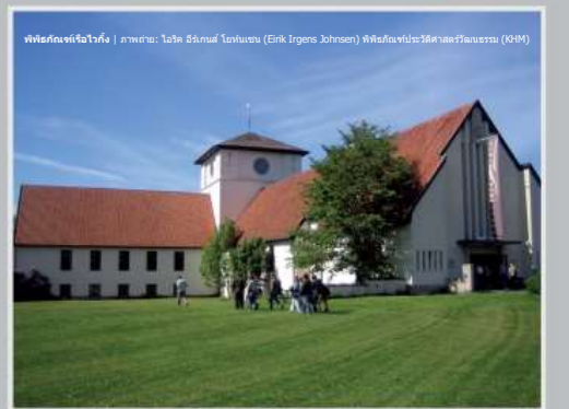
พิพิธภัณฑ์เรือไวกิ้ง | ภาพถ่าย: เอริก อีริกเซน โยห์นเซน (Eirik Irgens Johnsen) พิพิธภัณฑ์ประวัติศาสตร์วัฒนธรรม (KHM)