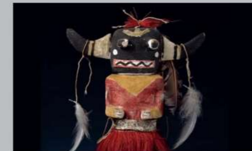
ตุ๊กตาลัทธินันเตเรีย (Kachina) จากเขตโฮปปี (Hopi) อาร์จอนา สหรัฐอเมริกา | ภาพถ่าย: แอนน์ คริสติน อีค (Ann Christine Eek) พิพิธภัณฑ์ประวัติศาสตร์วัฒนธรรม (KHM)

นิทรรศการนี้แสดงให้เห็นลักษณะการสร้างอัตลักษณ์และประเพณีของคนพื้นเมืองและชนกลุ่มน้อยเมื่อต้องเผชิญกับโลกที่กว้างใหญ่ ในส่วนนี้คุณจะได้เห็นหน้ากาก งานแกะสลักไม้ ลูกบิด งานเย็บปักถักร้อย และเครื่องแต่งกาย พบกับงานออกแบบอันเป็นนวัตกรรมผลงานช่างปั้นหม้อโฮปปี (Hopi) ชื่อ นัมเปโย (Nampeyo) งานศิลปะชนบทที่สวยงามจากอเมซอน และแท่นบูชาลัทธินันเตเรีย (Santeria) จากคิวบา