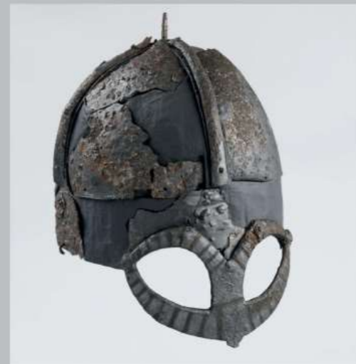
หมวกไวคิงที่อยู่ในสภาพสมบูรณ์ที่สุดในโลกจากเบิร์นบุดจ์ (Gjermundbu)