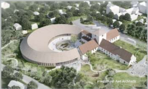
ภาพประกอบ: Aart Architects

มีการวางแผนจัดตั้งพิพิธภัณฑ์ยุคไวกิ้งแห่งใหม่ในนิกเดย (Bygdøy) วิลัยทัศน์สำหรับ การจัดตั้งพิพิธภัณฑ์แห่งใหม่คือการเป็นศูนย์กลางชั้นนำระดับโลกในการเผยแพร่ความรู้เกี่ยวกับยุคไวกิ้ง จะมีการจัดแสดงนิทรรศการเกี่ยวกับเรือฝังศพของไวกิ้งและความมั่งคั่งของพวกเขา พร้อมด้วยสิ่งของที่คัดสรรมาเป็นจำนวนมากจากรบราสมบัตินอื่น ๆ ในยุคไวกิ้งของพิพิธภัณฑ์