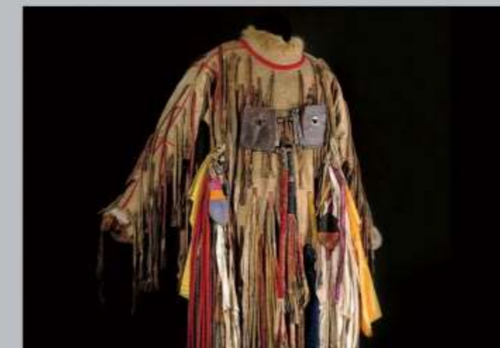
เครื่องแต่งกายแบบหิมะขาว (Tuva) รูดคิมที่นำมาทอเป็นเครื่องแต่งกายแสดงให้เห็นถึงพลังและความแข็งแกร่งของทอคิม

ผู้คนและวัฒนธรรมทางตอนเหนือของวงกลมอาร์กติก (Arctic Circle) มีสิ่งใดร่วมกัน รวมถึงมีสิ่งใดที่จำแนกผู้คนและวัฒนธรรมในพื้นที่ดังกล่าวให้ แตกต่างกัน นิทรรศการนี้จัดแสดงเสื้อผ้าแบบดั้งเดิม เครื่องมือ งานศิลปะ และงานฝีมือจากกรีนแลนด์ ไชปีเรีย ตอนเหนือของแคนาดา อลาสกา และ ซัปมี (Sápmi) (พื้นที่ต่างๆ ในภูมิภาคซัปมี) อย่างหลากหลายจัดแสดง สิ่งของที่มีเอกลักษณ์เฉพาะตัวซึ่งได้มาจากการเดินทางของรูอัลด์ อามุนด์เซน (Roald Amundsen) ผ่านเส้นทางด้านตะวันตกเฉียงเหนือระหว่างปี 1903 - 1906