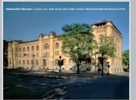
พิพิธภัณฑ์ประวัติศาสตร์

งานหลักของพิพิธภัณฑ์คือการวิจัย จัดการ และจัดแสดง นิทรรศการเกี่ยวกับเนื้อหาประวัติศาสตร์ที่เราร่วมกัน นิทรรศการในพิพิธภัณฑ์สะท้อนให้เห็นถึงความเชี่ยวชาญของเราในสาขาต่างๆ เช่น โบราณคดี ชาติพันธุ์วรรณา และเหรียญกษาปณ์