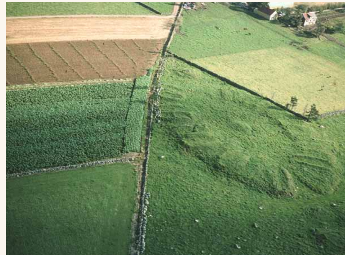
Dysjane på Tinghaug på Jæren var kanskje tingsted for hele eller halve Rogaland fra 200-600 e. Kr. Vi ser rester etter mange bygninger arrangert i to rekker. Haugen i midten kan ha blitt brukt som «talerstol» under samlingene, eller som møtested for en mindre forsamling eller «lagrett».

Det finnes en arkeologisk funngruppe som er virkelig særnorsk, de såkalte ringformede tunene. De er riktignok fra tiden før Norge ble Norge, og finnes bare på vestkysten av Norge, langs den egentlig Nordvegen. De forteller likevel historien om hvordan Norge ble til.