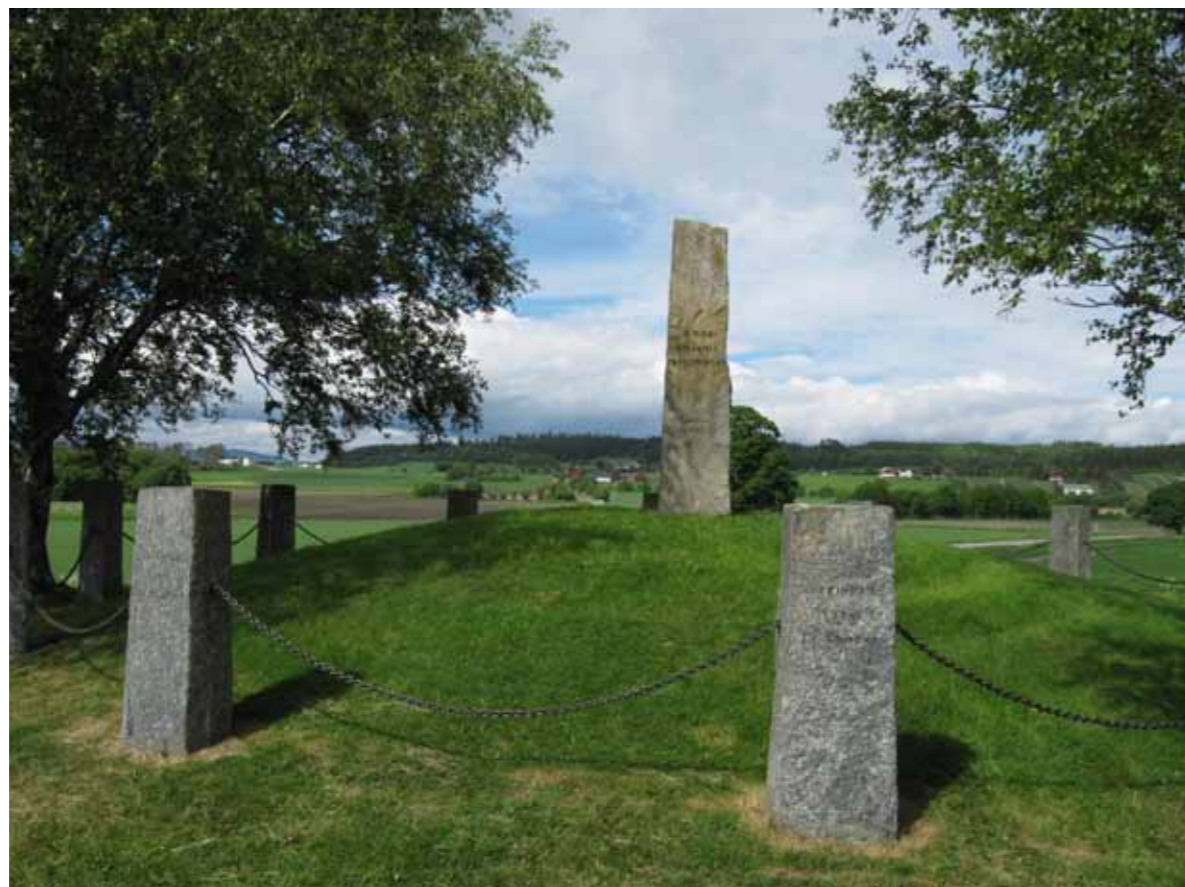
Frostating er knyttet til området på Loktu (Logtun) på Frosta i Nord-Trøndelag. På Tinghaugen reiste bygdefolket i 1914 et monument med bautasteiner til minne om tingstedet og det som foregikk her gjennom flere hundre år.

I 2012 utførte den danske arkeologen Mads Holst og hans team en større undersøkelse i nærheten av de berømte våpenfunnene. De fant knokler fra hundrevis av unge menn i alderen 13 til 40 år. Flere var blitt såret i kamp og hadde kuttmerker i hode og bein. Det var også spor på knoklene etter gnaging fra rovdyr. Beina hadde havnet i myra i tiden rett etter Kristus, og var dermed eldre enn de rike våpenfunnene i nærheten.