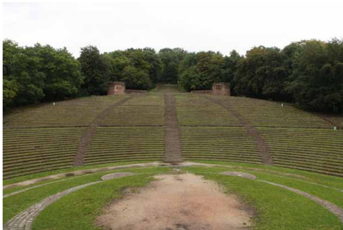
Misbrukt fortid. Heidelberg Thingstätte var ett av ca. 40 slike anlegg som ble oppført i Hitler-Tyskland i 1930-årene. Målet var å lage en ny germansk folkebevegelse. Anlegget hadde plass til 20 000 mennesker og ble åpnet av Joseph Goebbels i 1935.

Målet var å skape en ny germansk folkebevegelse. Propagandaminister Joseph Goebbels åpnet det første anlegget i juni 1935, i Heidelberg. Det var 25 meter høyt, hadde 56 seterader og plass til 20 000 mennesker. Anlegget minnet om et romersk amfiteater. Man visste lite konkret om hvordan germanske tingsteder egentlig hadde sett ut. Det er først i de senere år at man har begynt å forske på tinget igjen, og det er blodferske resultater fra nye undersøkelser vi skal se nærmere på her.